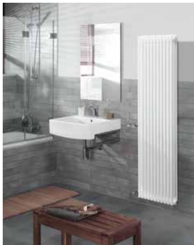
Dopo: Zehnder Charleston - stessa potenza termica con un design pregevole. Zehnder Charleston si inserisce armoniosamente nell'arredamento interno.