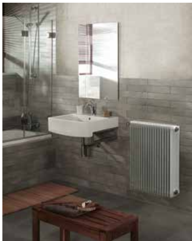
Prima: radiatore obsoleto a elementi