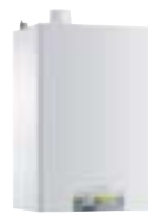
MCR BIC PLUS