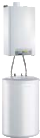
MCR PLUS 24 kW mit 130-l-Speicher