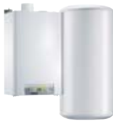
MCR PLUS 24 kW mit 80-l-Speicher