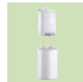
MCR 24/BS 80 PLUS

Heizkessel H 670 mm B 400 mm T 300 mm max. 90 kg Speicher H 912 mm Ø 570 mm